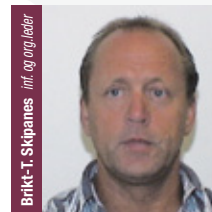
Brikt-T. Skipanes inf. og org.leder