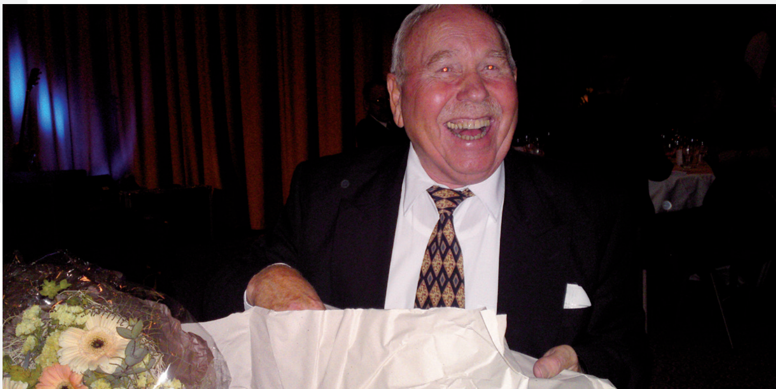
Jubilantene våre storkoste seg på avdelingens festmiddag.