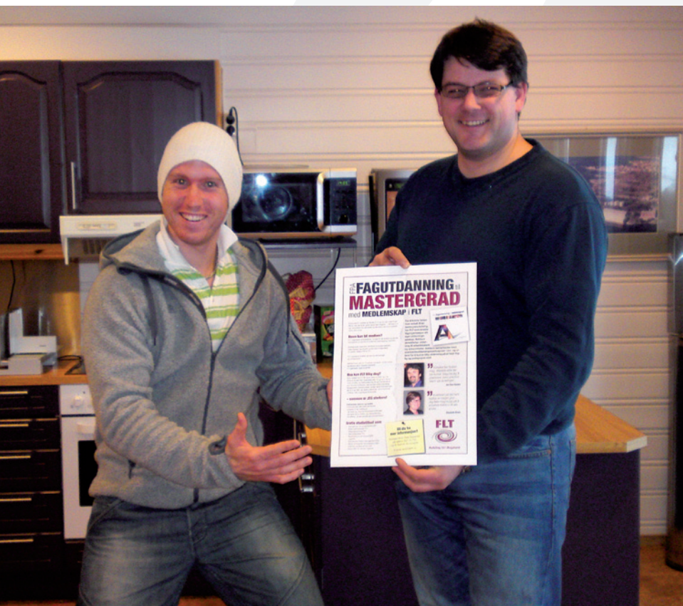
Medlemmer våre er storfornøyde med tilbudet om gratis etterutdanning, gjennom Addisco.