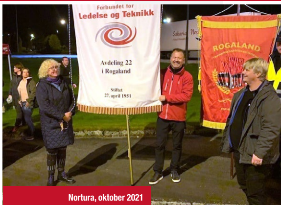
Nortura, oktober 2021