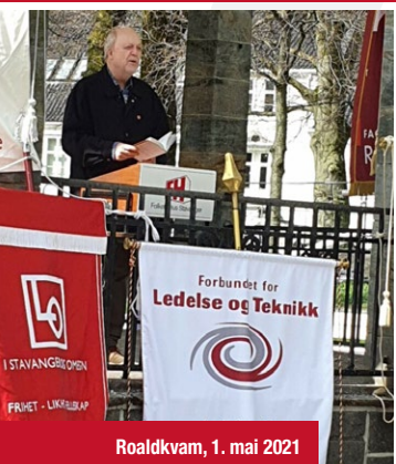
Roaldkvam, 1. mai 2021