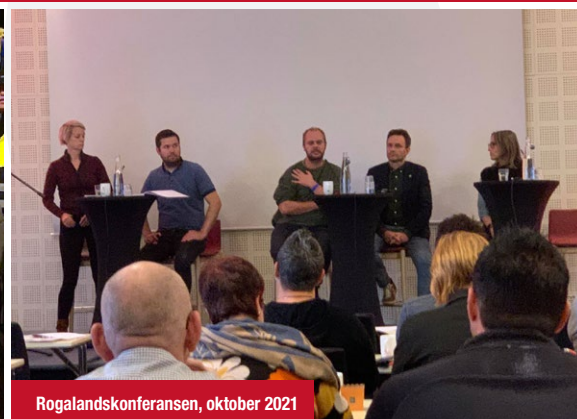
Rogalandskonferansen, oktober 2021